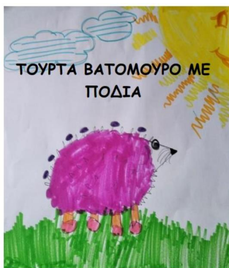
Γ2 ΤΑΞΗ- 1 ο ΔΗΜΟΤΙΚΟΥ ΣΧΟΛΕΙΟΥ ΜΕΝΕΜΕΝΗΣ